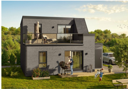
MINIHUS: Slik vil minihusene i Prävenlia på Raufoss se ut når de er ferdig.