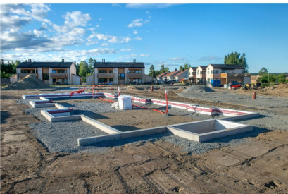
PRØVENLIA: Her vil de første minihusene reise seg fra midten av august og de seks første skal stå ferdig i september.

De første seks boligene vil bli ferdigstilt allerede i midten av september, de 10 neste vil stå ferdige innen midten av desember.